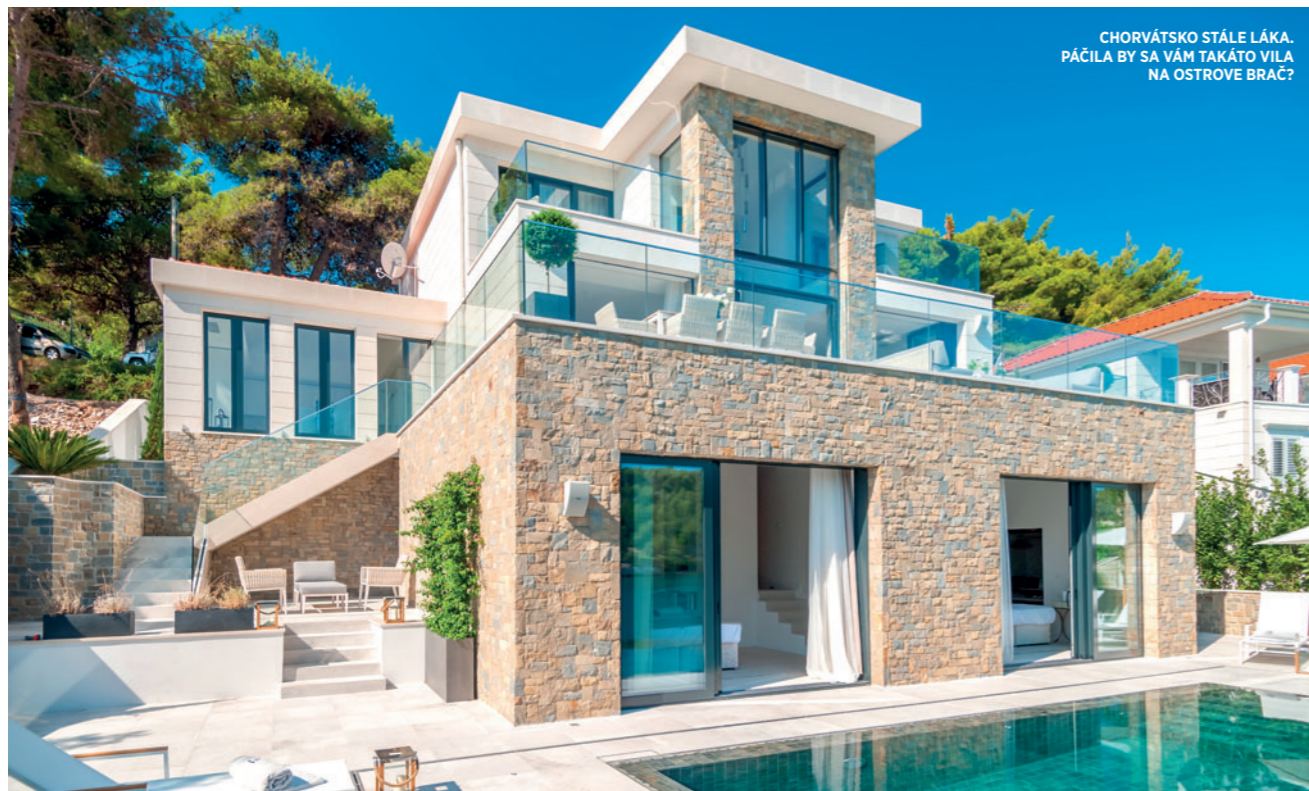
CHORVÁTSKO STÁLE LÁKA. PÁČILA BY SA VÁM TAKÁTO VILA NA OSTROVE BRAC?